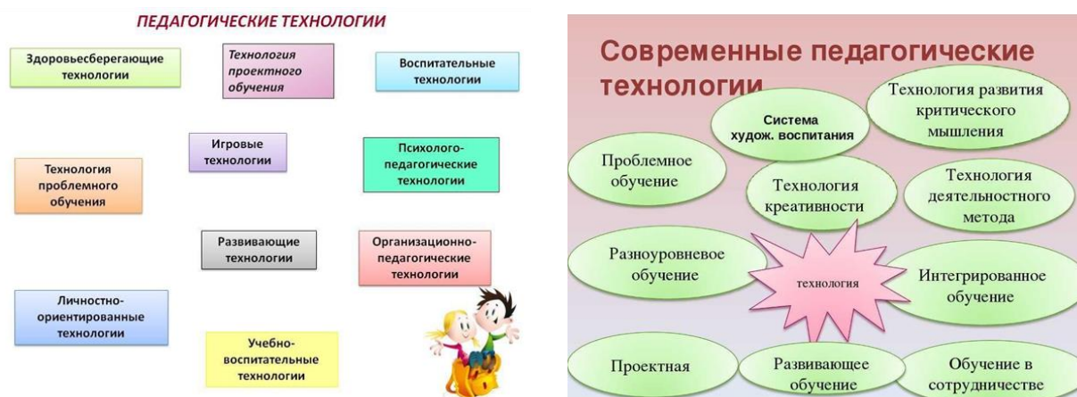
Рисунок 2, 3. Современные педагогические технологии и методы работы с детьми

В современных условиях воспитательная деятельность с детьми требует адаптации методов и технологий к специфическим потребностям образовательного процесса. Педагоги должны активно представлять детям множество разнообразных методов, ориентируясь на индивидуальные особенности каждого ребенка и направляя развитие его творческих способностей. Интерактивные методы, такие как игры и практическая деятельность, становятся особенно актуальными, поскольку они позволяют детям не