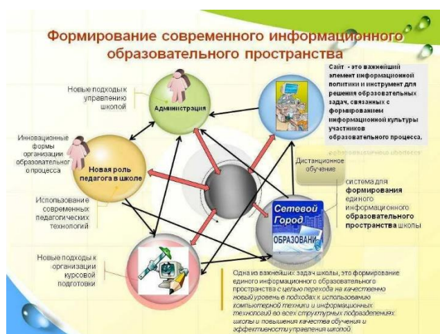
Рисунок 1. Схема формирования образовательного пространства

Создание предметно-пространственной среды для детей требует учета различных принципов, способствующих их развитию и комфорту. Важно, чтобы такая среда была многофункциональной и могла выполнять многочисленные задачи. Многофункциональность помогает создать пространство, которое может использоваться в различных целях, включая игры, обучение и творчество. Это позволяет детям адаптироваться к изменениям и самим определять, как они будут взаимодействовать с окружающей средой.